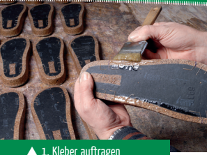
▲ 1. Kleber auftragen