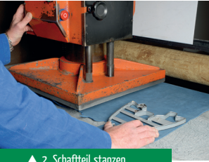
▲ 2. Schaftteil stanzen