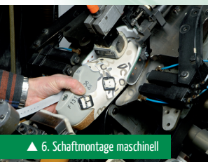
▲ 6. Schaftmontage maschinell