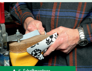
▲ 5. Schaftmontage