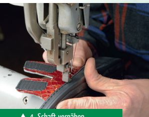
▲ 4. Schaft vernähen